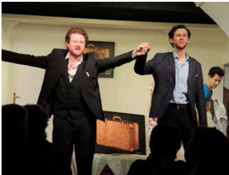
Reset - Alles auf Anfang

Herbert, ein erfolgreicher Geschäftsmann in den besten Jahren (richtig, das sind die, die gleich nach den guten kommen), hat eigentlich alles. Eine Ehefrau – sie ist schwer hysterisch, zugegeben, aber sie versucht, es mit Yoga in den Griff zu kriegen. Ein Verhältnis mit seiner jungen Sekretärin – sie will leider ein Kind von ihm und auch noch, dass er sich endlich scheiden lässt. Einen enterbten schwulen Halbbruder, der ohne viel zu fragen bei ihm eingezogen ist. Sogar einen Magritte an der Wand hat Herbert.