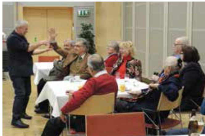
verblüffte und staunende Zuseher

Am 6. Februar fand diesmal im Julius Raab Saal der Wirtschaftskammer OÖ der erste Bürgernachmittag des Jahres 2019 im Zeichen der amüsanten Faschingszeit statt.