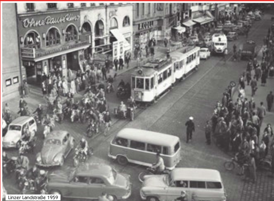
Linzer Landstraße 1959