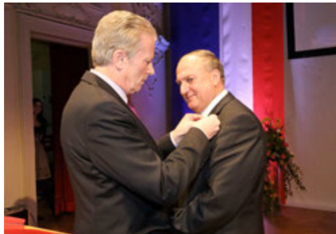
Minister Mitterlehner steckte Trauner das Große Goldene Ehrenzeichen an.