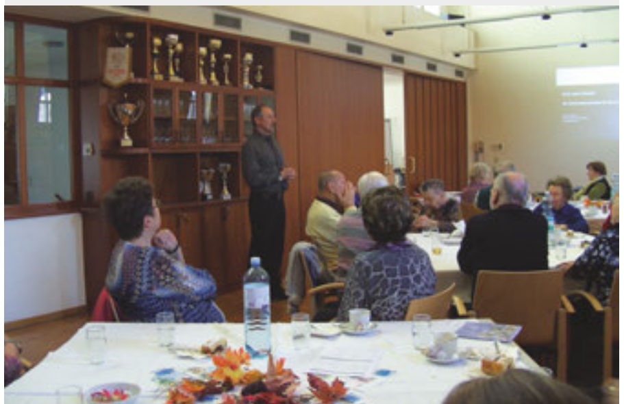
Vortragender mit Publikum