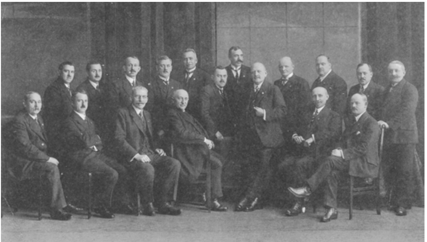
Der Vorstand der „Linzer Bürgertischgesellschaft“ im Jahre 1924