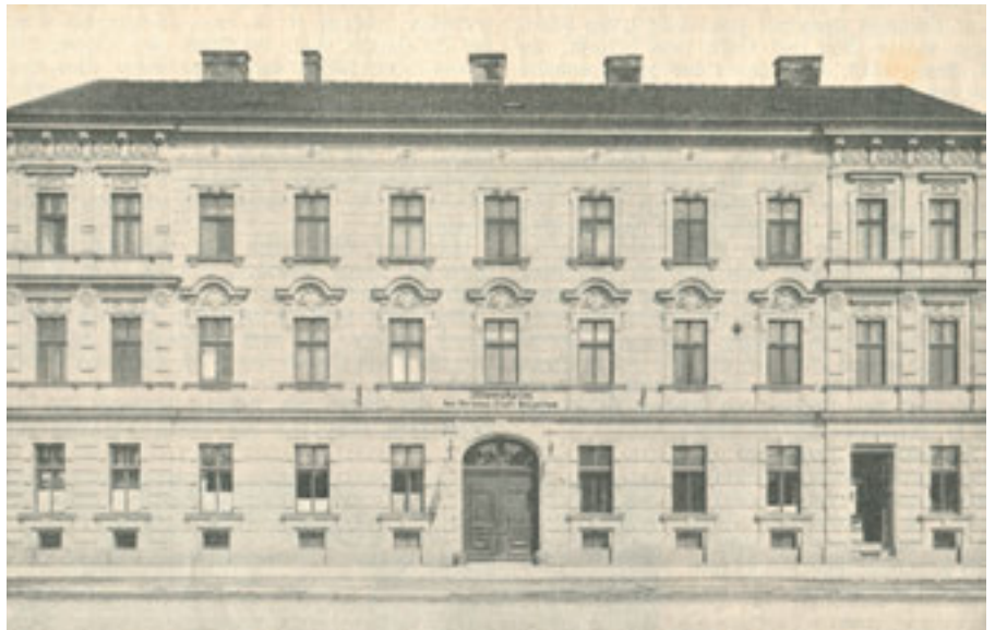
Das Bürgerhaus nach der ersten Renovierung im Jahr 1926 (rechts ein Lebensmittelgeschäft)