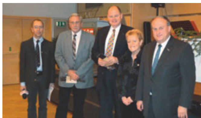
Die neuen Mitglieder