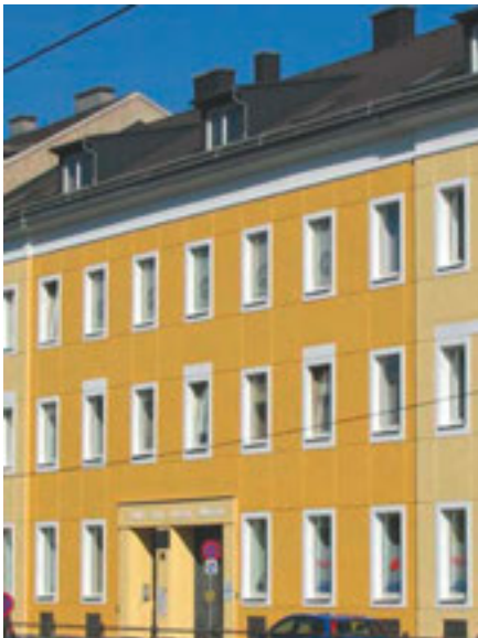
Das Bürgerhaus heute