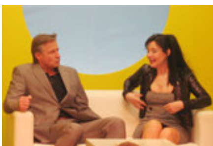
Boxchampion Robert und Claudine

„Kurzurlaub“ zu machen. Claudine gibt vor ihre Mutter zu besuchen und bei Bernhard steht plötzlich eine „Dienstreise“ für den Herrn Direktor an. Auch Anna soll sich nach Vorstellung ihrer Dienstgeber einen wohlverdienten Urlaub gönnen. Als die beiden weg sind, nützt Anna jedoch die Gelegenheit, um zu Hause mit einem bzw.